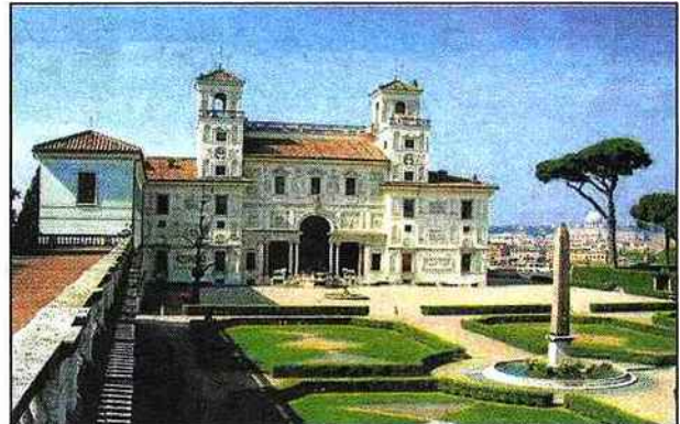
La Villa Médicis à Rome, haut lieu culturel.

En suivant les pérégrinations du grand peintre PIERRE SOULAGES, originaire de Rodez, nous pouvons annoncer que l'Académie de France à Rome - Villa Médicis présente du 2 mars au 16 juin 2013 l' exposition Soulages XXI e siècle . Première exposition consacrée en Italie au plus grand peintre français vivant , elle montrera une sélection de tableaux et d'oeuvres sur papier réalisés depuis le début de notre siècle. Réalisée en collaboration avec le Musée des Beaux-Arts de Lyon, l'exposition Soulages XXI e siècle montre comment cet artiste reconnu internationalement depuis la fin des années 1940 est aujourd'hui un artiste pleinement contemporain. À 93 ans, il continue de renouveler profondément les possibilités de la peinture abstraite, ouvrant des voies nouvelles à partir d'une conception de l'art exigeante qu'il s'est forgée très tôt.