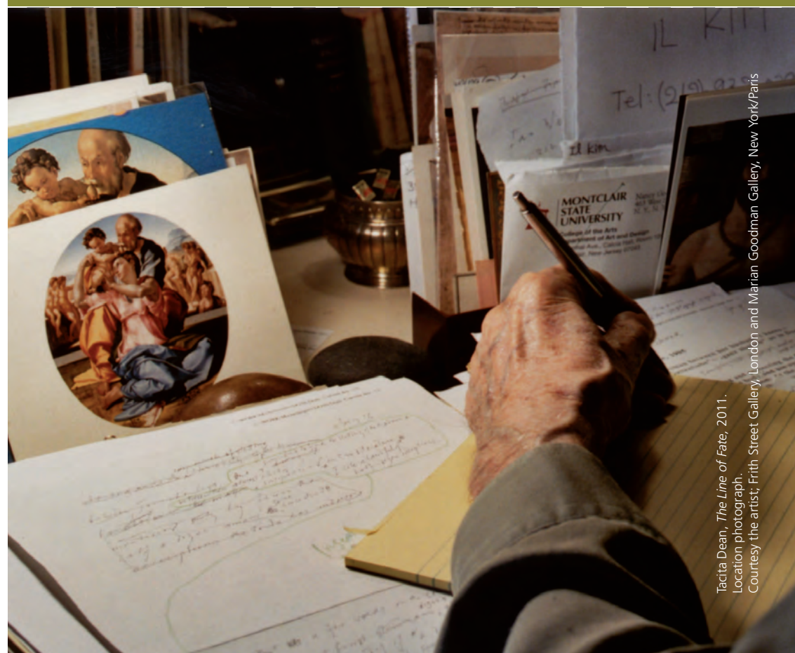
Tacta Dean, The Line of Fate , 2011. Location photograph.

"Leo Steinberg Now" - la prima conferenza internazionale dedicata allo studioso - propone un'inedita lettura ad ampio raggio della sua opera evidenziando il ruolo che essa ha svolto nel dibattito culturale europeo e statunitense del XX secolo e le questioni teoriche e di metodo che ha sollevato negli studi storico-artistici.